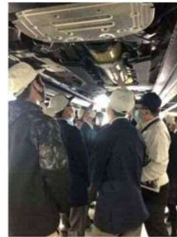
新型MIRAI実車を使用した実習