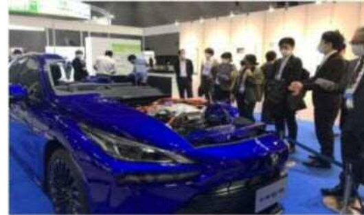
ブース展示の様子