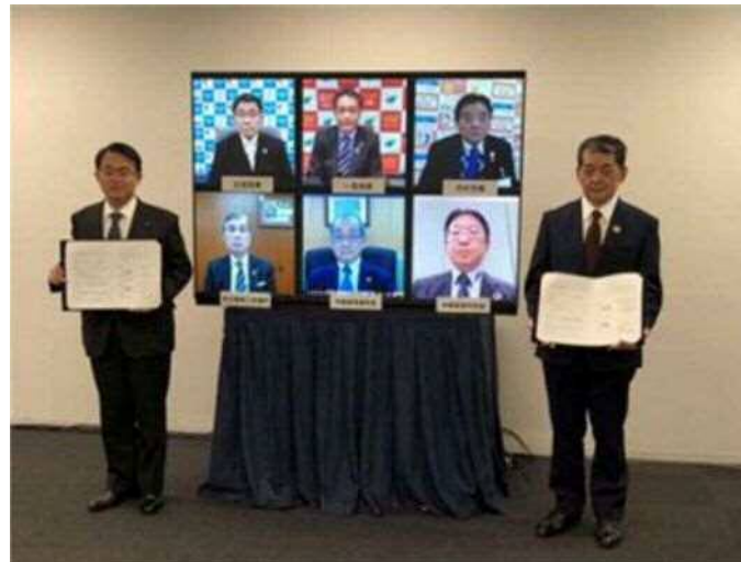
包括連携協定締結式