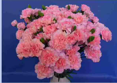
本県育成カーネーション 「カーネアイノウ1号」

コロナ以後、販売量低下から単価も低下しているため、生産コストの削減が可能で商品性の高い品種の必要性が増している。