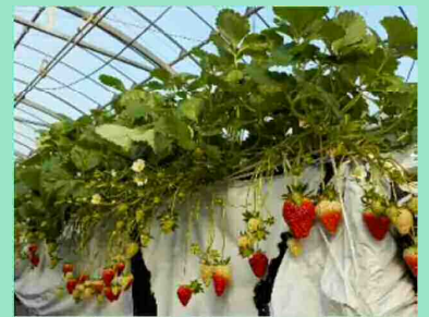
イチゴのハウス栽培