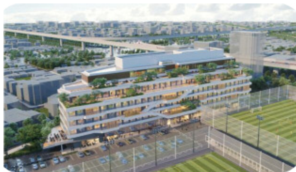
STATION Ai のイメージ図

○ 農業分野においては、「みどりの食料システム戦略」で掲げられたイノベーション創出に向けて、民間企業や大学が持つ最新技術を活用した産学官連携、スマート農業技術の開発と普及の加速化、生産力強化と持続性の両立を可能とする技術や品種開発の推進が重要となる。そのため、スマート農業総合推進対策事業や公募型試験研究事業の拡大、安定的に品種開発を行うための施設整備への補助、本県が新たに実施する大学やスタートアップ等との産学官連携の取組への支援が必要である。