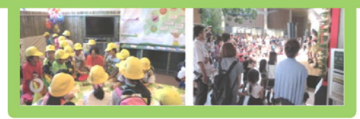
「あいちフェア市民村」