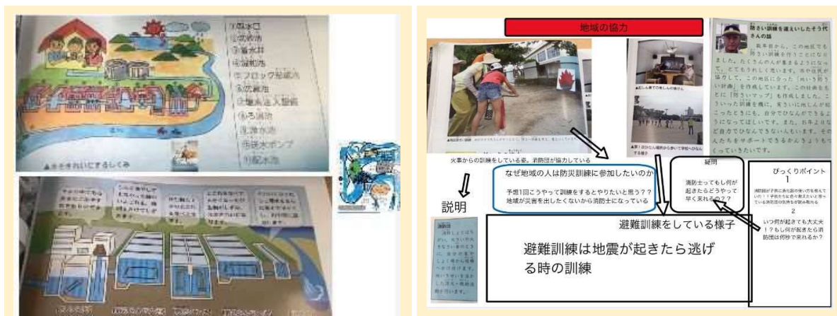
資料1 児童Aの年度初めのまとめ

はじめの課題は、教科書からどんな備えをしているか、調べる学習を進めた。学習に対する困り感の大きい児童Aの年度初めのまとめは、教科書の写真を張り付けるだけ（資料1）であったが、本時では、矢印等を効果的に使い、岡崎市の地震災害における地域の取り組みの関係性をまとめた（資料2）。年度始めよりスクールタクトを活用してきたことで、情報を関連付けたり、整理したりしながらまとめるなど、情報活用能力の向上が見られる。学習の進捗状況を教師はリアルタイムで把握し、個に応じた支援を行うことができた。