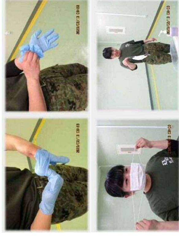
手袋・マスクの脱ぎ方「新型コロナウイルスから皆さんの安全を守るために（防衛省統合幕僚監部）」