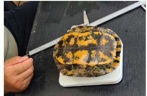
▲ 捕獲したカメの計測

ふれ愛パーク内の池などにカメトラップ（ワナ）を設置、その後回収するという方法でカメを捕獲しました。