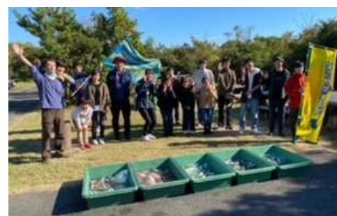
▲ タッチプールでは16種の生物と触れ合いました