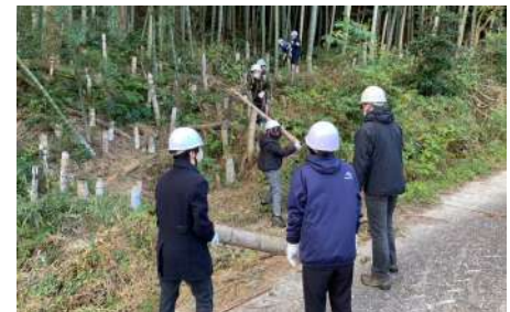
▲ 運び出し担当が焼き場に竹を運びます

ノコギリを使って竹を切る方法を教わりました。最低一人一本は竹を切ることができました。その後、斜面から竹を運び出す体験もしました。