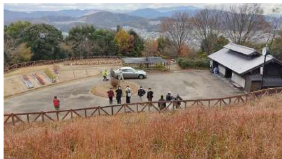
▲園内に設けられた茅場

東三河ふるさと公園では、旧東海道の宿場町『御油宿』にみられる近隣郷土の風景をテーマとした公園づくりがなされています。そして「東三河地域環境リーダー」さんは、園内の三河山野草園において里山の景観の一つ「茅場」の再現を目指してカヤネズミの棲む草原の再生に取り組んでいます。具体的な活動は植生の定期的な調査、年1、2回の草刈り、侵略的外来種の駆除です。また、保全活動をPRするイベントを年1回開催しています。