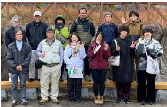
▲東三河地域環境リーダーのみなさんとの集合写真

草地にはさまざまな在来野草がある一方、外来植物のメリケンカルカヤ、セイタカアワダチソウは周囲の他の植物の成長を阻害していました。茅場を再生するにあたって外来植物の侵入を防いだり駆除したりするのはなぜなのか、自然環境を保全する上でどのように指針を立てるべきなのか、多くのことを学び、考えさせられる活動でした。