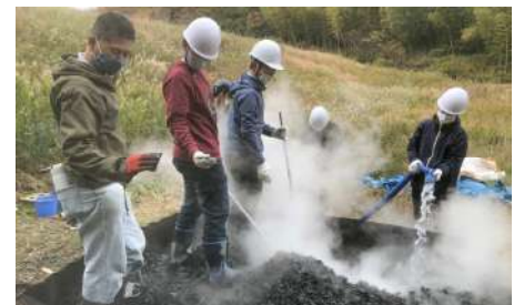
▲ 竹を焼いてポラス炭を作りました

伐採した竹を焼いて炭を作り、水で冷まして回収しました。このポラス炭は微生物の活動を促進させる効果があるので土壌改良材として有効に利用されるそうです。