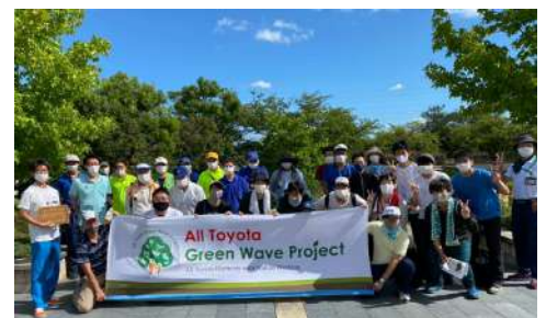
▲ 参加した皆さんと一緒に集合写真

外来生物を悪者扱いするような行動を慎むべきであること、そして私たちと生き物との関わり方を考える必要があると強く感じました。