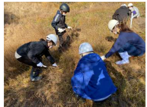
▲ 黙々と草刈りしている様子

シラタマホシクサは絶滅危惧種ですが、すでに種子を落としているため来年の生育への影響はありません。むしろこのまま枯れさせると後々に土を肥えさせてしまい湿地の貧栄養状態を保てないので、刈り取る必要があるのです。