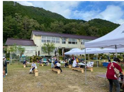
▲ のき山学校で行われたてほへ交流会 ピザづくり体験や地元産品の販売がありました

自然や風景、歴史、文化、技、人に刺激を受け、ここに集う皆さんが新たなつながりを発見、創造できる「みんなの学校」を目指しています。