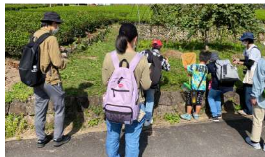
▲ 生物多様性モニタリング調査 のき山学校周辺を歩いて調査しました

のき山学校でてほへ交流会が行われており、地域の人達が鹿肉の唐揚げや山菜ご飯を売っていたりしていました。