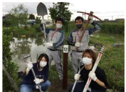
▲ ビオトープの案内標柱が完成！！

生き物の視点で建設事業のあり方を考えるという貴重な体験をさせていただき、考え方が変わりました。「建設事業は自然環境に負荷を与える」というイメージを持つ人は少なくないと思います。しかし、今回の活動を通じ、生き物の視点で現場を見ること、そして工夫することで、生態系保全を図れることを知りました。自然と共存できる建設事業について考えるエコミーティングが標準的に行われるようになれば、生き物と共存できる社会に近づくのだと感じました。