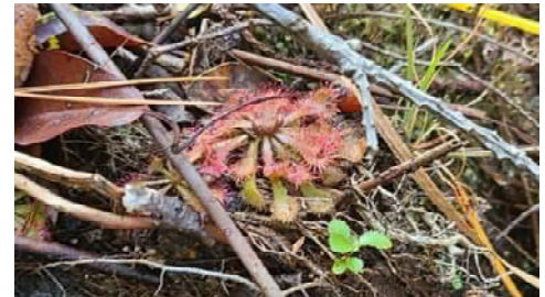
▲ 湿地に生育する食虫植物のトウカイコモウセンゴケ

そのためこの過酷な環境に適応した、ミミカキグサやトウカイコモウセンゴケなどといった珍しい植物が多く生息しています。長久手の湿地もその一例です。