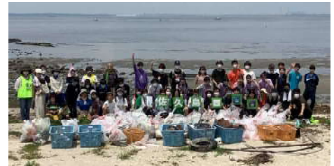
▲ 海岸清掃後の集合写真

「島を美しくつくる会」さんは、佐久島の豊かな自然を守るとともに、島の活性化を推進するため、藻場の再生、海岸清掃、島内の散策路整備をはじめとした保全活動はもちろん、佐久島の地域活性化に繋がる活動も実践されています。