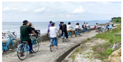
▲ 海岸のサイクリング

島内を自転車で周遊し、海の風を浴びながらその魅力に触れました。途中で自転車を降りて海岸や竹林で生き物を探したり、アート作品を鑑賞、体験するなど、さまざまなアクティビティを楽しみました。