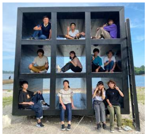
▲ <<おひるねハウス>>を体験

特に海岸ゴミの大半が三河湾地域の都市域に由来していることを知り、海岸ゴミの問題をより身近に感じました。都市域のゴミ削減が豊かな海を守る活動に繋がっているのだということを知ってもらえるよう発信していきたいと思えます。