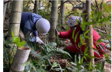
▲ 荒れた竹林で竹の切り方を教わりました

美浜町竹林整備事業化協議会、通称「モリビトの会」さんは、こうした問題を引き起こしている未整備竹林の再生を進めるとともに、山の幸であるタケノコやシイタケを味わい楽しむ活動、地域農業の活性化に関わる活動、豊かな生態系の回復による田園地帯の観光資源化に繋がる活動を行っています。