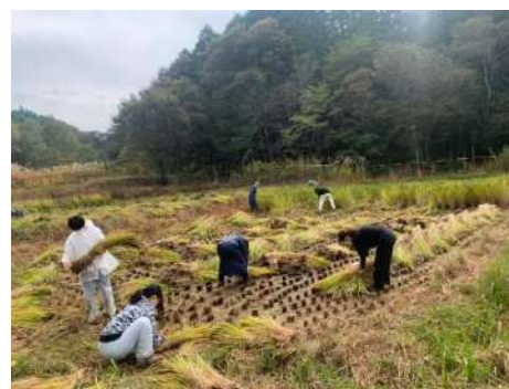
▲ 稲束を運ぶ準備をしています

作業の中で周りに目を凝らすと虫やカエルがたくさん見つかり、田んぼを取り巻く多くの生物によって生態系が成り立っていることを感じました。