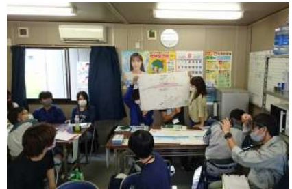
▲ エコミーティング体験

株加藤建設さんが生き物との共存を目指して実際に施工中の建設現場を視察させていただきました。その後、生き物の目線から「どのような環境になれば生き物が過ごしやすくなるか」について意見交換するエコミーティング体験をしました。