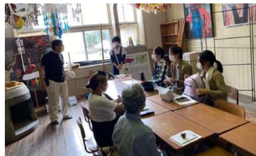
▲ 観察した植物とその写真をもとに復習を行いました

のき山学校では東栄町の魅力的な風土の中で、新しい発見、学び、気づきを得ました。多くの人にのき山学校に足を運んでいただきたいです。私達も今後も東栄町で活動をしていきたいと思います。