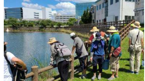
▲ 地域のみなさんとビオトープを観察

その一環として「刈谷ふれ愛パーク」を設立し、地域のみなさんがスポーツができる場所、農業が体験できる場所を提供するとともに、自然共生の場としてビオトープも創出しています。