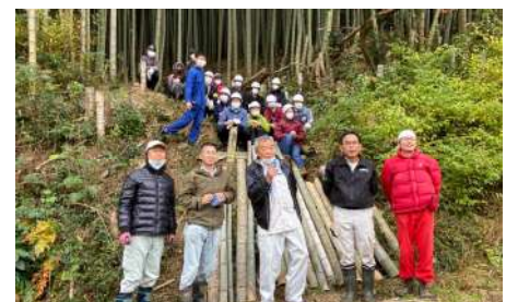
▲ モリビトの会のみなさんとの集合写真

モリビトの会の方はさまざまな視点から解決方法を検討されていて、大きな学びになりました。放置竹林と生物多様性の関係やモウソウチクの利活用について、GAIAとしても発信し続ける必要があると感じました。