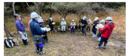
▲ 長久手湿地保全の会の皆さんと意見交換