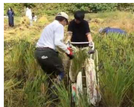
▲ バインダーを使う体験

バインダー（稲刈りと稲束づくりを同時に行う機械）も少し使わせていただきました。また、稲の品種によって稲穂の色や収穫時期、収穫時の稲の倒れ具合が違うというように現場でしか知ることのできないことをたくさん学びました。