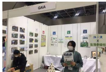
▲コースエリアでのブース出展