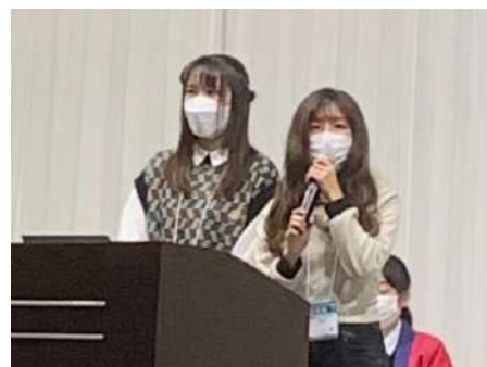
▲メインステージでのプレゼン、緊張しました

今回の活動を通じて、多くの方にGAIAの活動をはじめ、身近にみられる生物多様性やその重要性について発信できた有意義な活動でした。