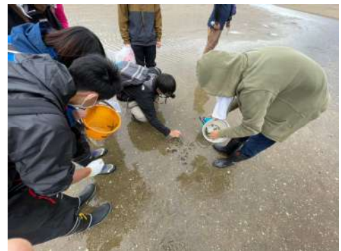
▲トンボロ干潟生き物観察 顔を近づけて小さな生き物を観察しました