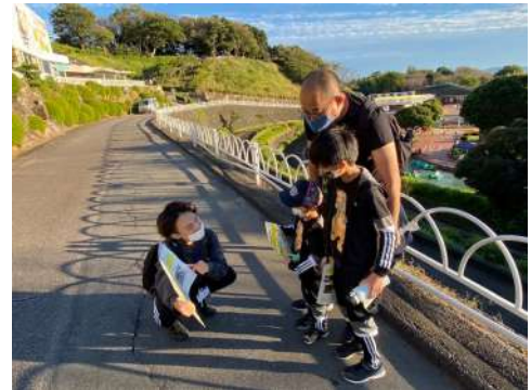
▲生きものスタンプラリー フィールドワークで学んだことをクイズを通して子どもたちに伝えることができました

愛知こどもの国さんでの活動はほかのフィールドワークと違って、来園した子どもたちに伝えるというところまで行うことができるので、今後また、愛知こどもの国さんでGAIAが企画したイベントを実施したいと考えています。