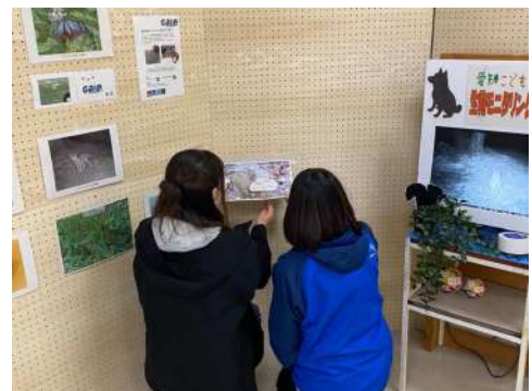
▲展示物作成 干潟に生息する生き物について展示物を作成、展示しました