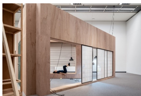
国際芸術祭「あいち2022」 展示／パフォーマンス風景 笹本晃《リスの手法：境界線の幅》2022 ○ 国際芸術祭「あいち」組織委員会 撮影：ToLoLo studio