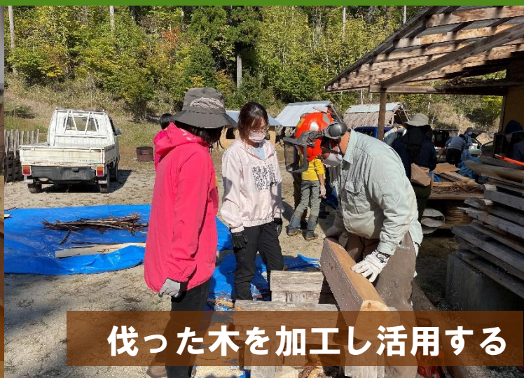
伐った木を加工し活用する