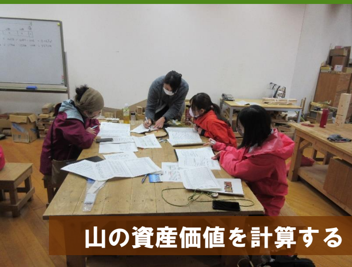
山の資産価値を計算する