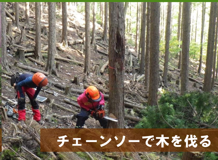
チェーンソーで木を伐る