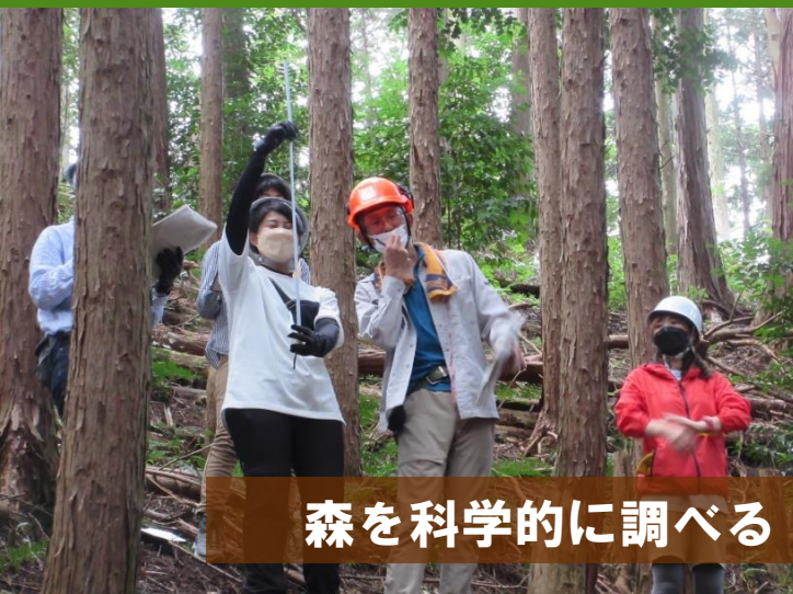
森を科学的に調べる