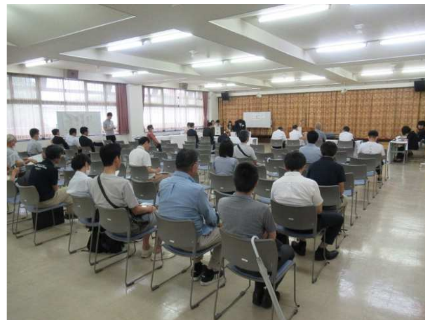
公聴会当日の写真