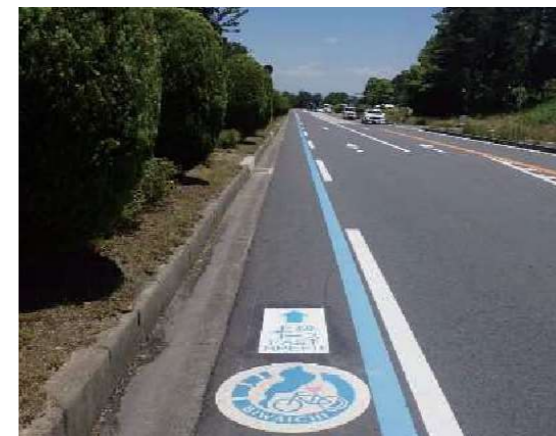
▲適切な自転車通行空間整備の例（滋賀県：ピワイチ）