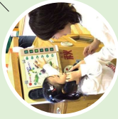
自然の声を聞いてみよう

自分でさわったり動かしたりできる展示や映像、本などで、自然や環境について学べます。