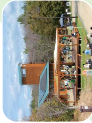
もりの学舎 ☆ふれあいテラス