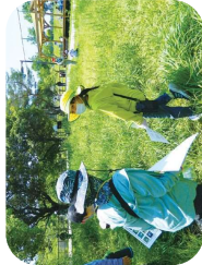
もりの学舎前ひろば