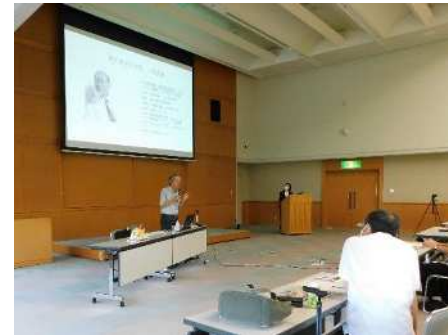
県政 150 周年連携イベント 「愛知県の建物 150 年」 (2022/7/30)