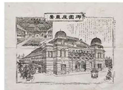
名所図「御園座真景」