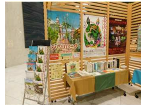
展示「祝 ジブリパーク開園！ ジブリ関連図書展示」 (2022/10/14~12/7)