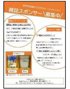
雑誌スポンサー制度チラシ