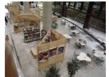
1階エントランス Yotteko（ヨッテコ）