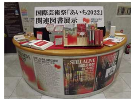
展示「国際芸術祭「あいち 2022」 関連図書展示」(2022/7/15~10/12)