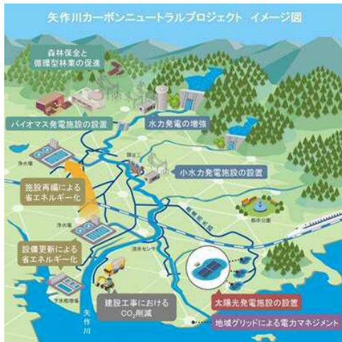
矢作川カーボンニュートラルプロジェクトのイメージ図