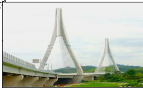
「新東名高速道路」 日本の交通の要衝として道路網が充実