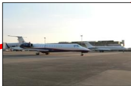
「県営名古屋空港」 コンピューター航空、ビジネス機、 小型機の拠点空港