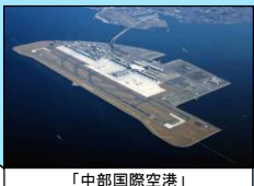
「中部国際空港」 24時間利用可能な国際空港 二本目滑走路の整備