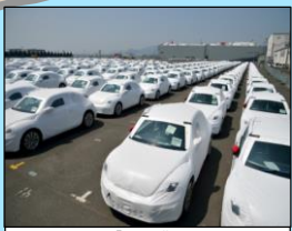
「三河港」 日本一の自動車流通港湾