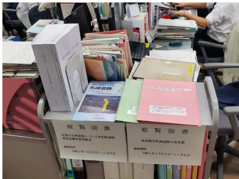
愛知県庁都市計画課