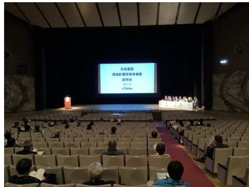
準備書説明会当日の写真