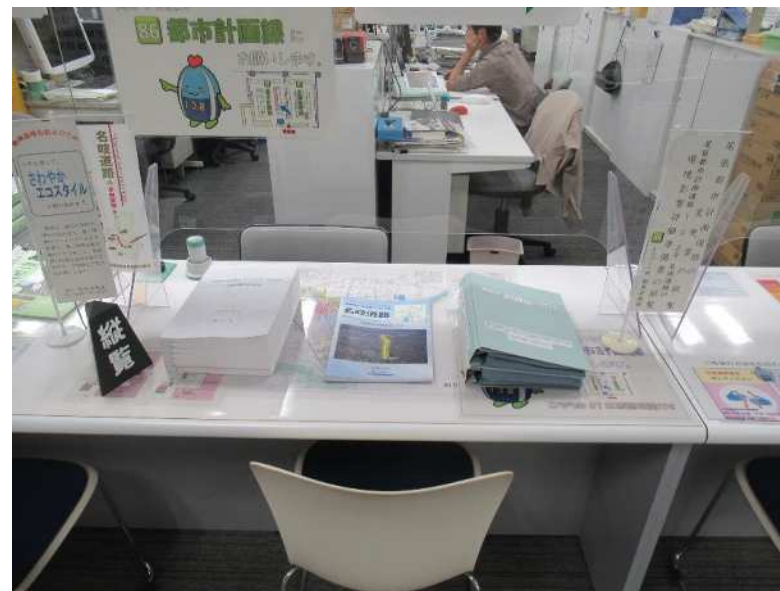
一宮市役所都市計画課