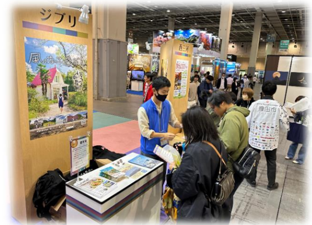
ツーリズムEXPOジャパンでの配布の様子