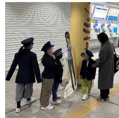
制服試着・撮影会の様子