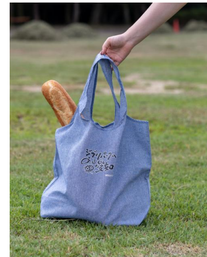
特典のノベルティ (オリジナルマルシェバッグ)