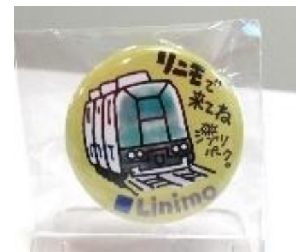
(株)スタジオジブリがデザインした 「限定缶バッジ」