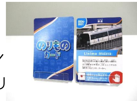
のりものカード