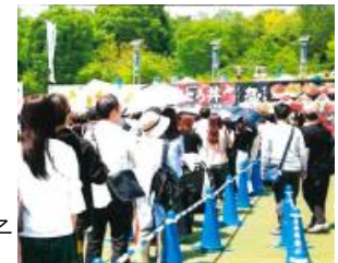
うまいもの祭りの様子