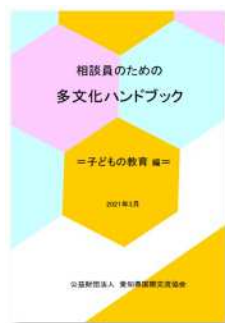
子どもの教育編 (2021年3月発行)