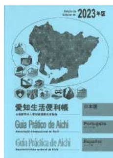
ポルトガル語・スペイン語版 (2023年9月発行)

愛知県で生活をしている外国人住民や外国人相談担当者に役立つよう、在留手続き、労働、結婚・離婚、出産・育児、教育をはじめ日常生活に関する生活情報を集めた冊子を作成する。隔年で、英語・中国語版、ポルトガル語・スペイン語版を作成し、日本語も併記することで、制度やサービスの説明をする際に関係機関の方の指差しツールとしても活用できる。