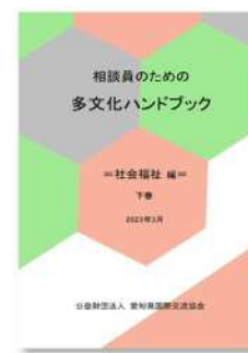
社会福祉編 下巻 (2023年3月発行)