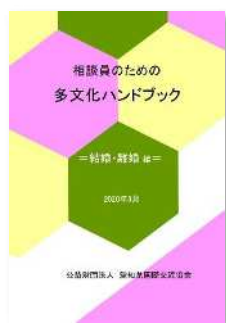
結婚・離婚編 (2020年3月発行)

外国人住民がより充実した行政サービスを受けることができるようにするため、当協会に寄せられた相談事例をもとに、外国人特有の問題やその背景となる各国事情、相談対応のポイント等を含めた相談対応冊子を作成し、市町村・市町村国際交流協会、社会福祉関係機関等の相談窓口へ配布する。