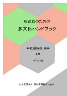
社会福祉編 上巻 (2022年3月発行)