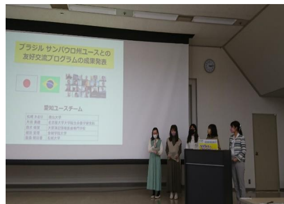
<「生物多様性とSDGs多世代フォーラム」での成果発表>