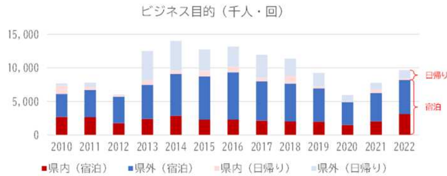
愛知県来訪者の推移（ビジネス目的）