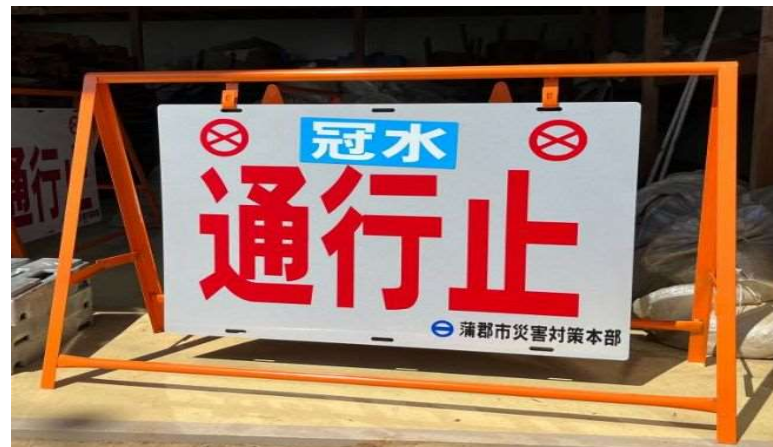
冠水等における通行止の看板を自主作成