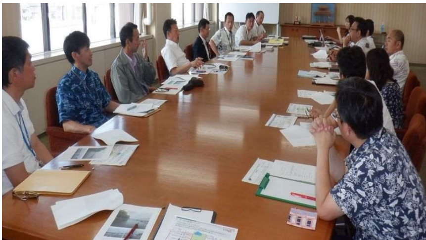
令和5年7月11日（蒲郡市役所5階庁議室）