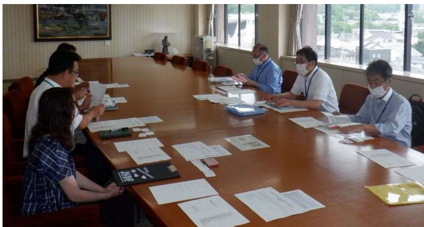
令和5年6月30日（蒲郡市役所5階庁議室）