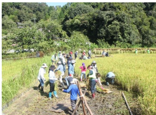
里と森の教室 （稲刈り）