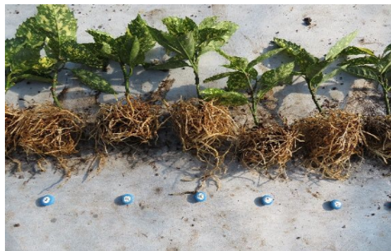
調査研究業務：ポット生産におけるルーピングの軽減について