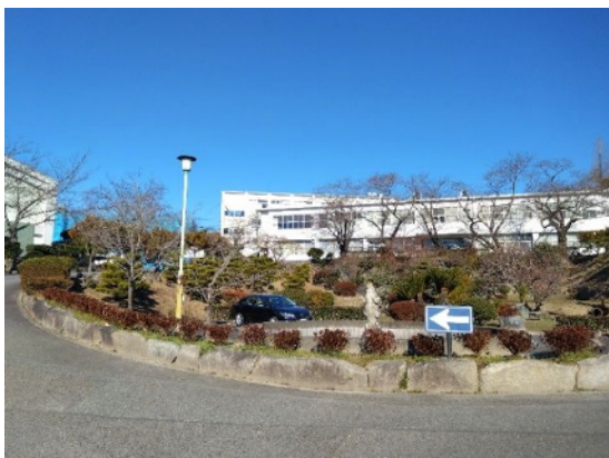
岩津高校(サツキの植栽)