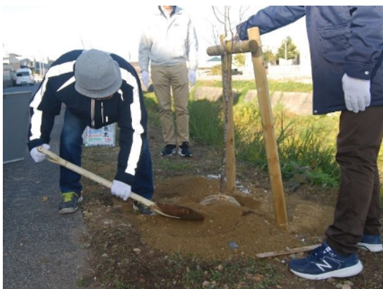
植樹中（県営長久手第二住宅前）