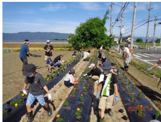
「立田広域委員会」 景観形成のための植栽