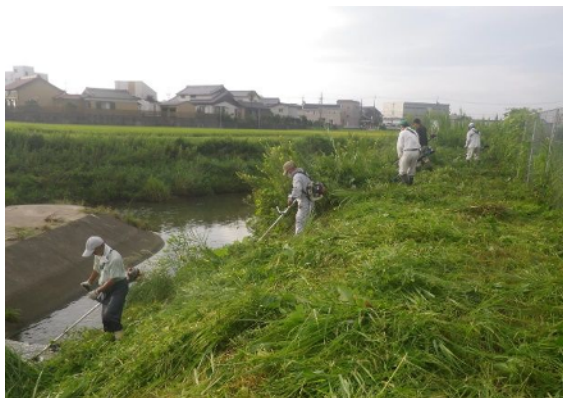
「箕輪町環境保全会」 草刈り隊による草刈り