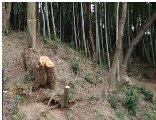
広葉樹の伐採状況