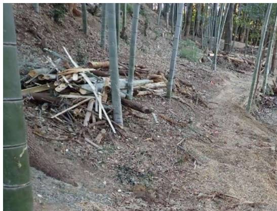
竹林と管理道の整備状況