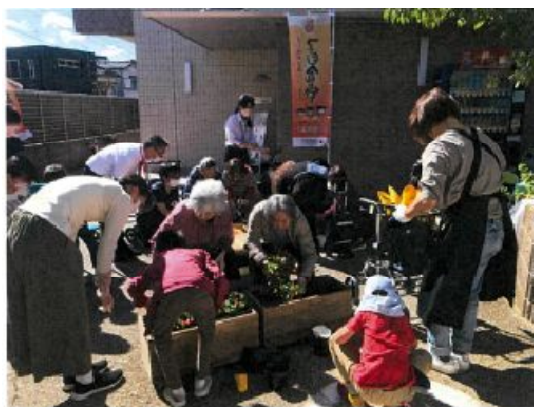
そんぼの家 s 新瑞東