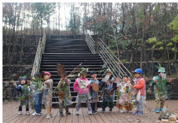
海上の森キッズアカデミー （森のようちえん）