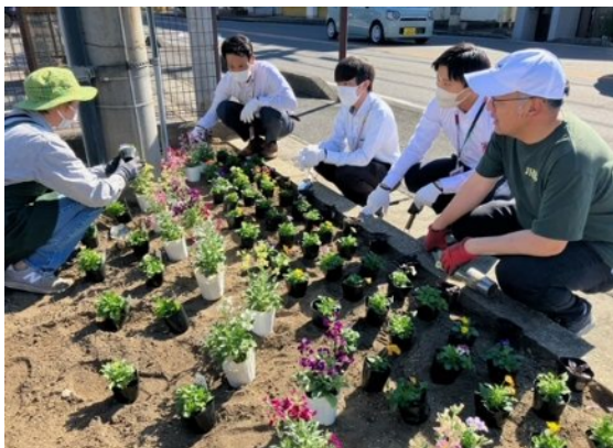
尾西信用金庫中島支店