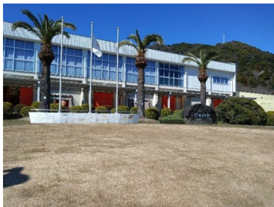
蒲郡東高校(芝生の造成)