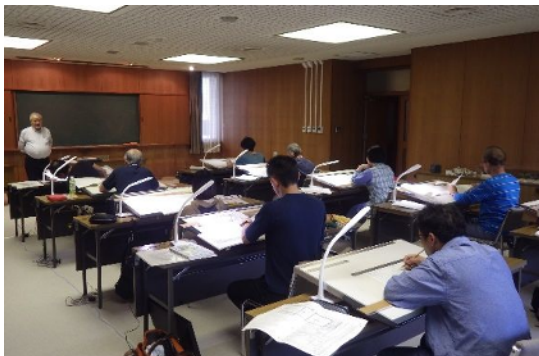
実務講座：「造園設計コース」