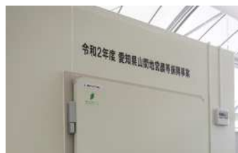
山間地営農等振興事業でプレハブ冷蔵庫を導入