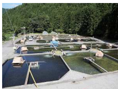
養殖されたマス類等 (養殖施設)