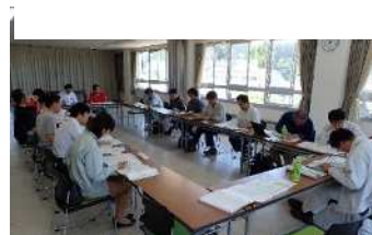
木材の需給調整会議