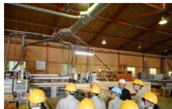
農林業視察研修会