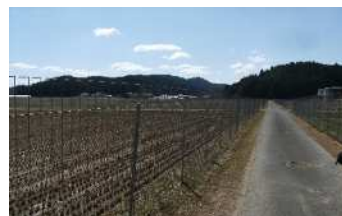
鳥獣侵入防止柵の設置状況