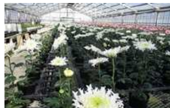
新品種 (かがり弁ギク)