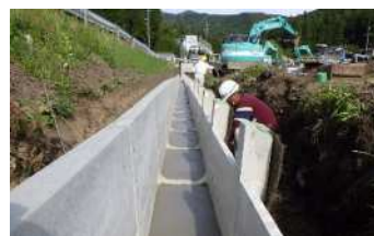
農業用排水路の整備