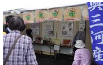
いいともあいち地域サロン