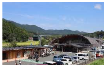
道の駅もつくる新城 (地域拠点施設)