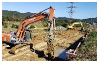
土質改良によるため池の耐震化工事