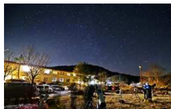
休暇村茶臼山高原の星空観察会 (イベント)