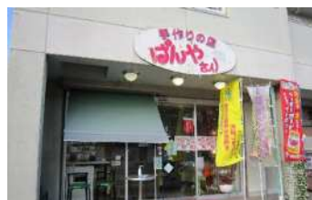
いいともあいち運動