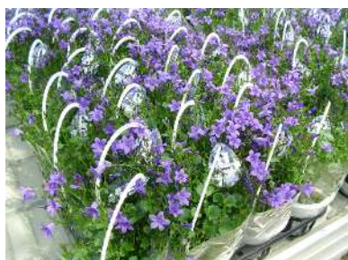
鉢花（ベルフラワー）