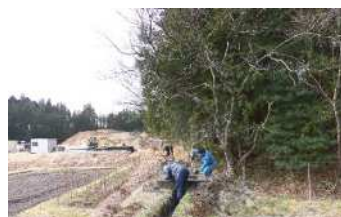
集落の農業生産活動