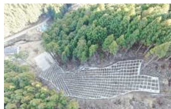
治山施設による山地災害地の復旧