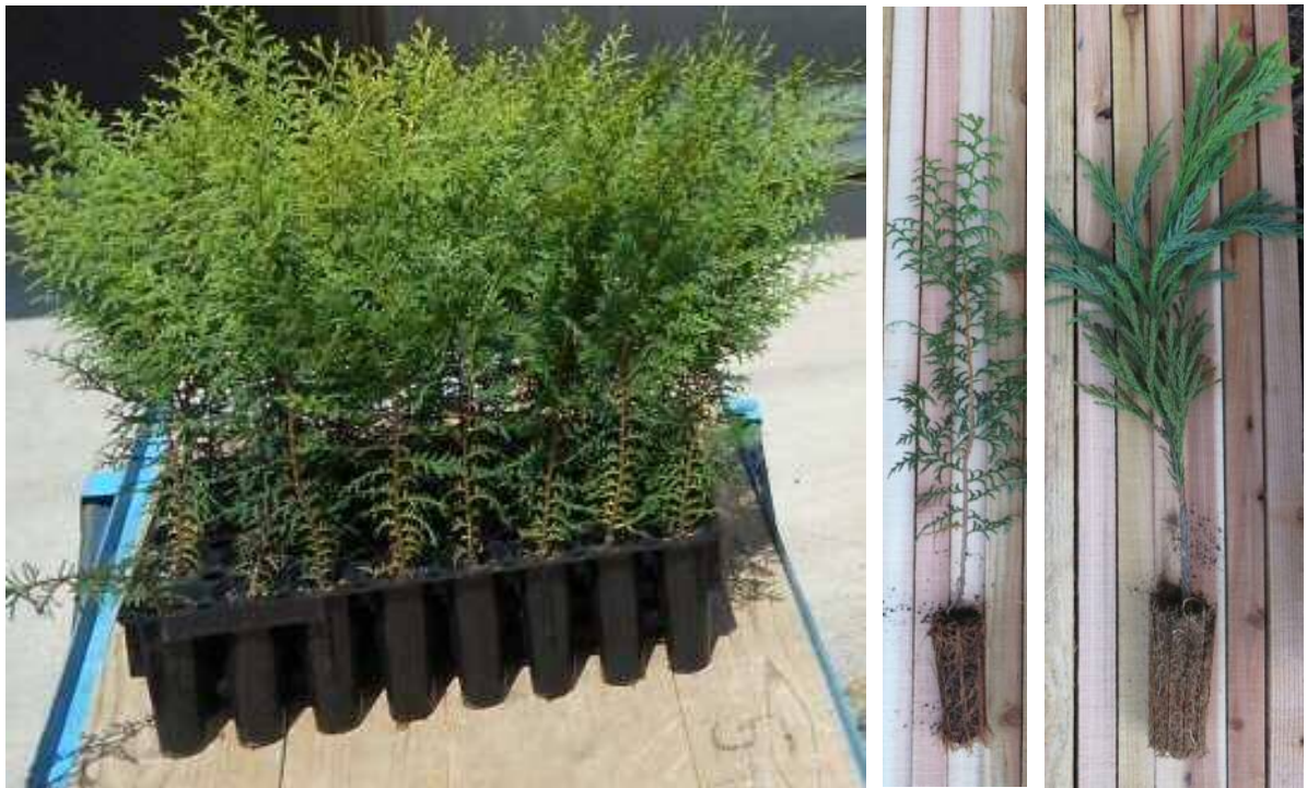
左：育成中の 150cc ヒノキコンテナ苗、中：150cc ヒノキコンテナ苗、右：300cc スギコンテナ苗