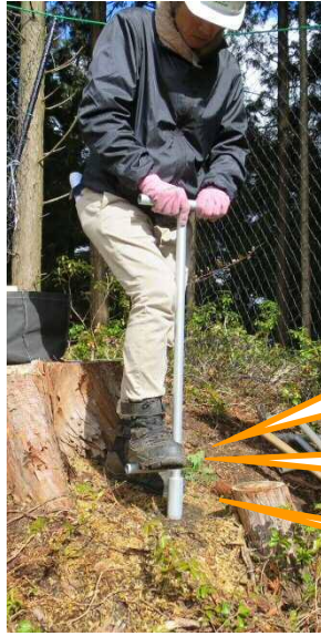
↑ コンテナ苗専用の植穴掘り器具（種類は様々です）