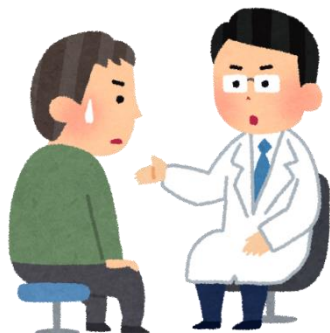
難病と診断された