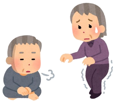
療養の中で 困りごとが出てきた