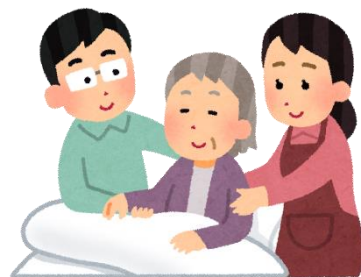
難病の家族がいる