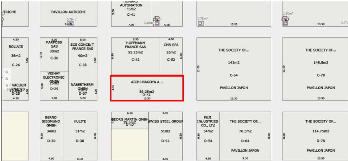
HALL 4 – Booth n° D51 – 12,5m x 4,5m – Net area : 56,25sqm