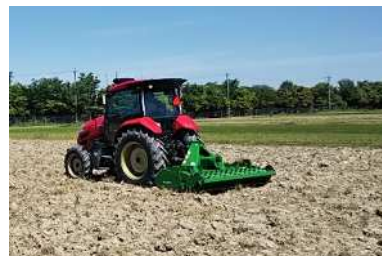
オートトラクタの実証