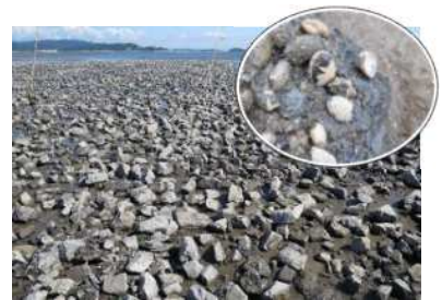
貝類増殖場と碎石に付着したアサリ