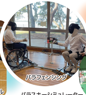
パラフェンシング パラスキーシミュレーター