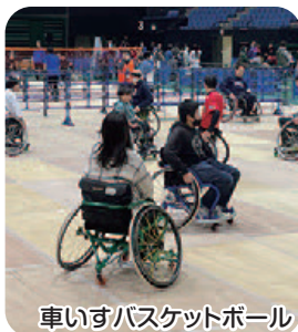
車いすバスケットボール