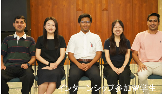
インターンシップ参加留学生