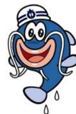
あいち防災キャラクター 防災ナマズン

あいち防災協働社会推進協議会事務局 （愛知県防災安全局防災部防災危機管理課内） 〒460-8501 名古屋市中区三の丸3-1-2 電話 052-954-6190 FAX 052-954-6911 E-mail bosai@pref.aichi.lg.jp